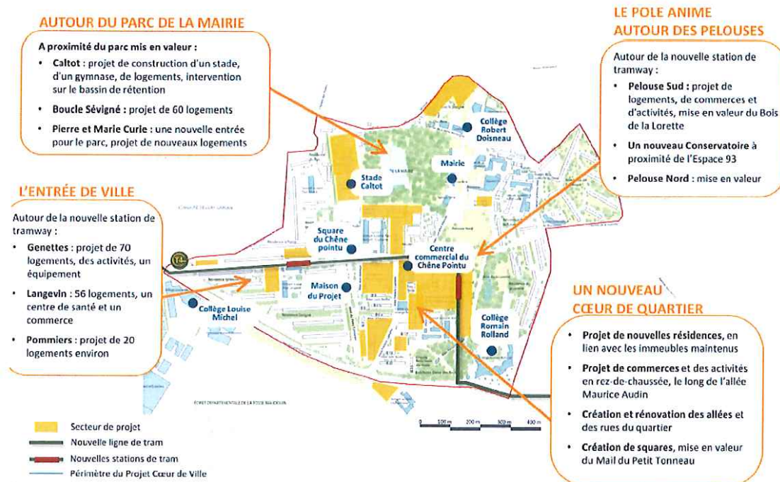
Fig 2 : Projet urbain de la ZAC Bas Clichy avec tracé du futur tramway Tzen4